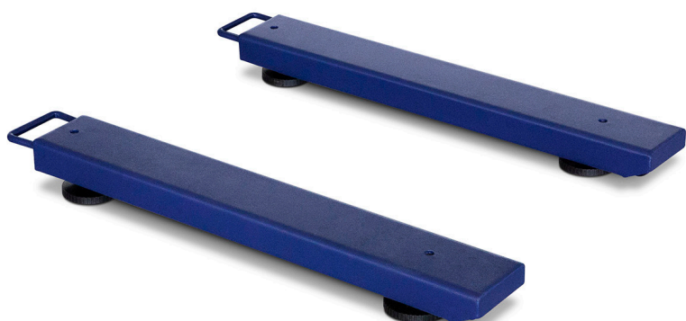
TX Fox 80

L'indicatore elettronico TX, altamente affidabile, include un cavo lungo 4 metri e può essere posizionato a distanza dalla piattaforma, su un tavolo o sul muro, con il suo supporto incluso. La risposta alla pesatura è estremamente rapida, mostrando il peso stabile con precisione in meno di 2 secondi.