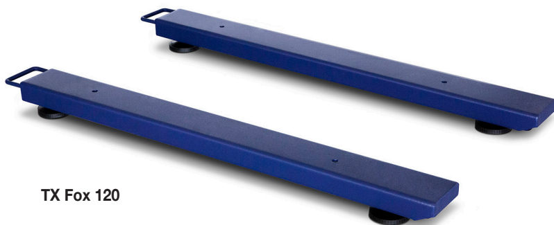
TX Fox 120

Calibrazione di serie. Il dispositivo è fornito debitamente calibrato e regolato dal nostro laboratorio di calibrazione situato a Barcellona.