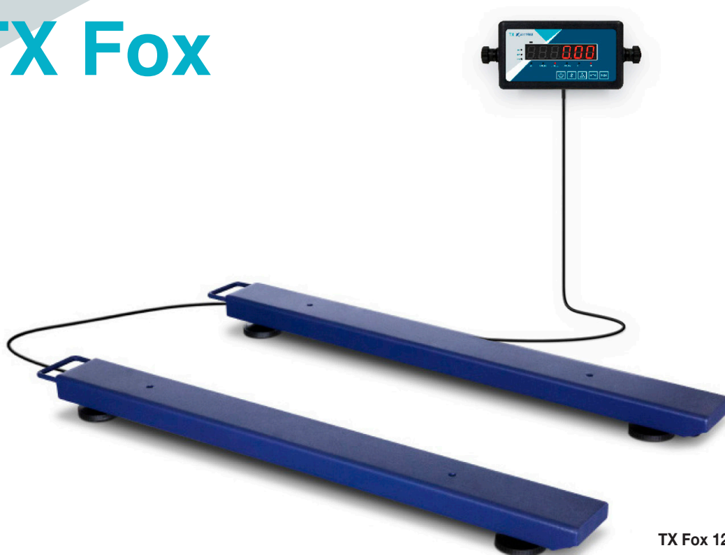
TX Fox 120