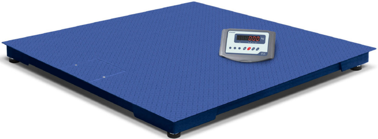
Plate-forme au sol robuste

Convient pour le pesage de palettes et de grandes charges, avec des capacités allant jusqu'à 3000 kg